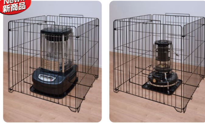
SGL-80B(MBK) 大型ストーブガード(業務用、対流型ストーブ対応)