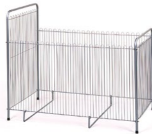
SG-120H(G) 薪ストーブ用ガード