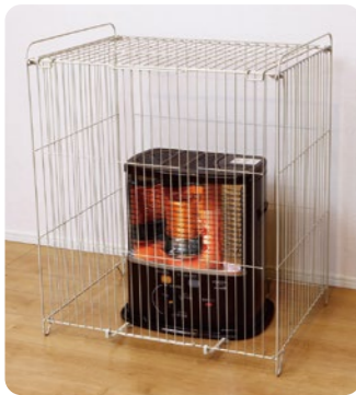
YSG-N 屋根付ストーブガード