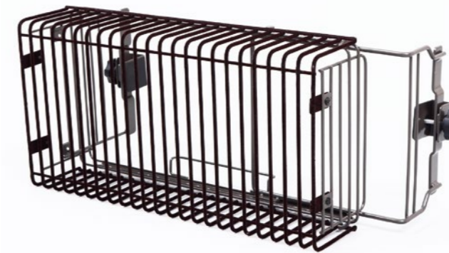
FG-49SN 吹き出し口ガード(石油ファンヒーター専用)