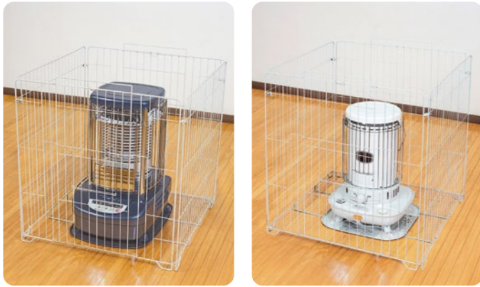
SGL-80B 大型ストーブガード(業務用、対流型ストーブ対応)